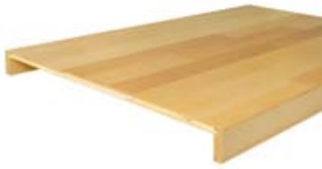
Massivholz-Stufenplatten Erhältlich als: Einzel-oder-Doppel- paket (Abb. bauseits verleimt)